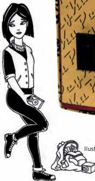
Ilustración: Pablo Javier Murias

TOMATE VACACIONES DE LA INMEDIATEZ DEL CELU, LA COMPU Y ANIMATE A EMPEZAR EL 2019 ARMANDO ESTA CÁMARA ARTESANAL CON LA QUE PODÉS HACER UNAS FOTOS DI-VI-NAS.