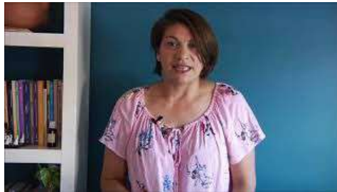
Video disponible en el Campus

comparto algunos datos más sobre los inicios de la fotografía y comenzamos a responder estos interrogantes que nos acompañarán a lo largo de toda la cursada. Les propongo tomar nota porque hay algunos datos que serán de gran ayuda para la actividad del foro.