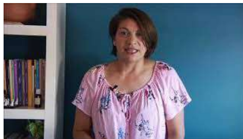
Video disponible en el Campus

En esta clase nos enfocaremos en la importancia que tiene la fotografía como un recurso didáctico en nuestra práctica educativa. Para analizar el alcance que puede tener vamos a desarrollar sus principales posibilidades, desde su lenguaje, la polisemia y la observación al momento de trabajar con una fotografía como al hacerla. Finalmente, a partir de 4 experiencias presentaré distintas formas de trabajar la fotografía en educación.