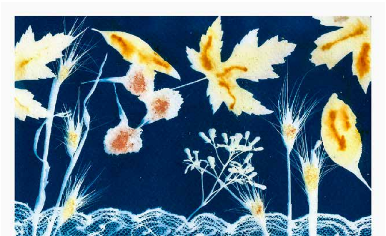
Foto de Tapa: José J Maldonado Imagen de Contratapa: Cecilia Fernández

Fe de errata: En el número anterior se omitió el nombre de Oscar Rodríguez como autor de la Nota: Estenopeica el recuerdo de un sueño , pág. 7